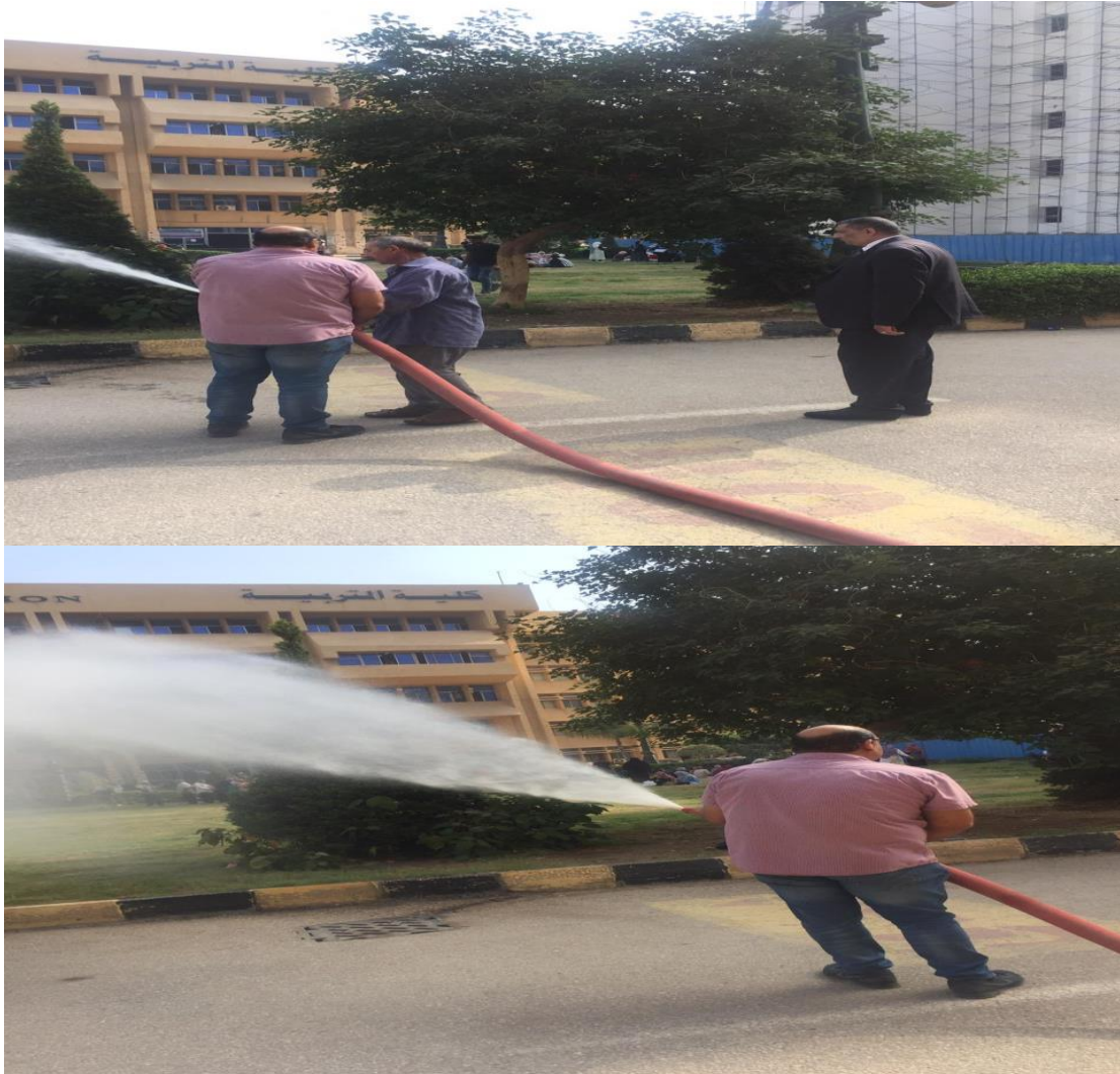
صور تجربة الحريق

* قامت الكلية بعمل تجربة لمنظومة الاطفاء بالكلية لمراجعة موقف تشغيل شبكات مكافحة الحريق على اكمل وجه و كما تم تنفيذ تجربة حريق كاملة لتدريب المختصين بالكلية . كما تم تجربة جميع صناديق اطفاء الحريق بالكلية ومراجعة حالة جميع محابس الاطفاء التلقائي للتأكد من انها فى وضع مفتوح اتوماتيكي وتبين ان المنظومة تعمل بحالة جيدة وعلى استعداد لمواجهة اى كوارث حريق لا قدر الله .