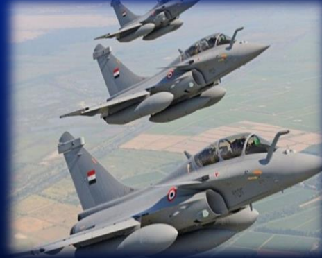
( طائرات الرافال طراز قديم وبها عيوب )