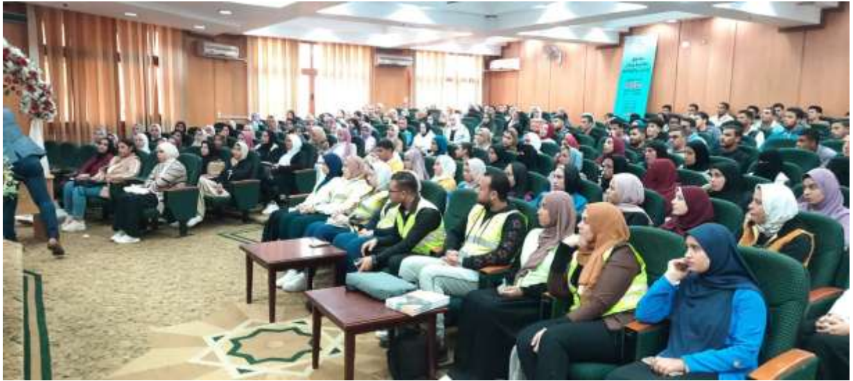
ثالثا اللجنة الاجتماعية وخدمة الطلاب:

1. في اطار التعاون بين كلية التجارة والادارة العامة لرعاية الشباب ادارة النشاط الاجتماعي وادارة التكافل بالإدارة العامة تحت رعاية فخامة السيد رئيس الجمهورية والسيد الاستاذ الدكتور رئيس الجامعة وصندوق تحيا مصر للتخفيف عن ابنائنا الطلاب تم تنفيذ مبادرة صندوق تحيا مصر دكان الفرحة والتي استهدفت ابنائنا الطلاب من كلية التجارة وطلاب الجامعة بمبادرة دكان الفرحة والذي تم فيه توزيع جهاز للمقبلين على الزواج وكذلك ملابس جديدة لأبنائنا الطلاب والطالبات وقد استفاد من هذه المبادرة عدد ( 250 ) طالب من طلاب كلية التجارة بواقع (5) خمس قطع ملابس جديدة مختلفة ماركات عالمية تم توزيعها عليهم وقد اعرب السيد الاستاذ الدكتور محمد عبدالعال نائب رئيس الجامعة عن سعادته عند تفقد معروضات «دكان الفرحة» الذي ينظمه "صندوق تحيا مصر" لرعاية طلاب الجامعات المصرية بتنظيم المعرض الذي يوفر آلاف القطع من الملابس الجديدة والأحذية والإكسسوارات من أفضل المنتجات وأجودها لطلاب الجامعة مستحقي الدعم والرعاية بعد دراسة حالتهم من خلال صندوق التكافل الطلابي بالجامعة لإدخال البسمة والفرحة على نفوس أبنائنا الطلاب والطالبات، مثنياً جهود الصندوق التي يسعى من خلالها لتقديم أفضل الخدمات بكافة القطاعات الخدمية والتنموية وتنفيذ أنشطة وبرامج الحماية الاجتماعية للأسر الأولى بالرعاية بكافة القرى والنجوع وقد تم الاتصال بالطلاب تليفونيا وخلال وسائل التواصل الاجتماعي للحضور لاستلام الكروت الخاصة بهم وذلك بعد ارسال رسالة SMS للطلاب من خلال صندوق تحيا مصر بالبركود الخاص بكل طالب للحضور لاستلام الهدايا شخصيا وحضور حفل الافتتاح الذي حضره مستشار الرئيس عبدالفتاح السيسي ورئيس صندوق