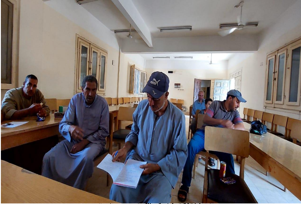
تنفيذ قافلة إرشادية وذلك تحت عنوان "

" التوصيات الفنية لرعاية المحاصيل الصيفية المشروعات الصغيرة "