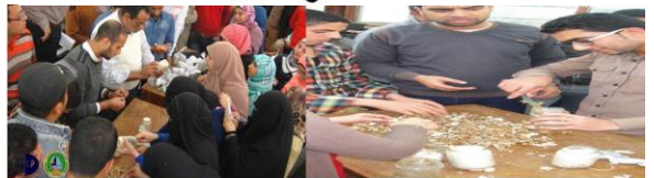
استخدام التدريب الميداني على إنتاج عيش الغراب لخلق جيل من الطلاب والشباب مدريا وصاحب مشروع صغير