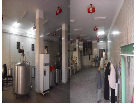
صالة تصنيع الألبان