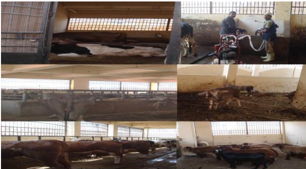
مزرعة الإنتاج الحيواني من الداخل