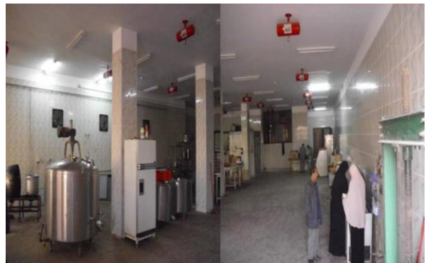
صالة تصنيع الألبان