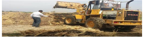
نشاط تدوير المخلفات لإنتاج السماد العضوي (الكمبوست) بوحدة تدوير المخلفات مركز التجارب والبحوث الزراعية بالكلية