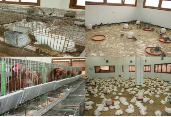
مزرعة إنتاج الدواجن من الداخل