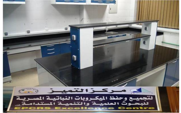
معمل أمراض النبات والبيوتكنولوجي