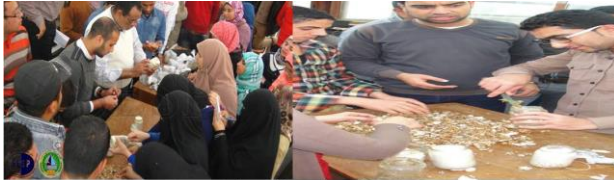
استخدام التدوير الميداني على إنتاج عيش الغراب لخلق جيل من الطلاب والشباب مدبرين وصاحبين مشروع صغير