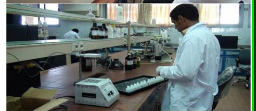
المعمد، الدكتور، لك أساتذة البنية