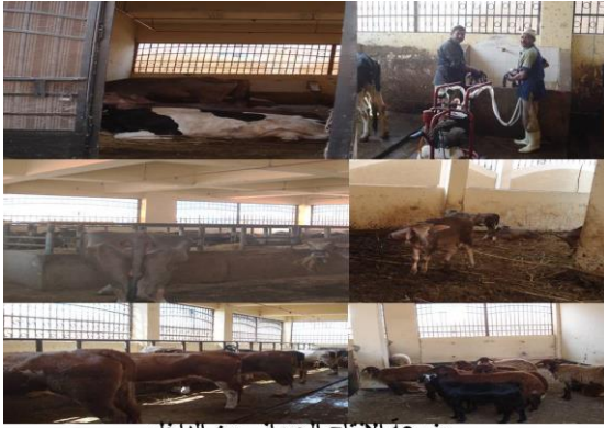
مزرعة الإنتاج الحيواني من الداخل