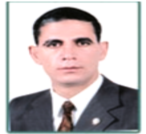
أ.د/ حسن حسن يونس نائب رئيس الجامعة لشئون الدراسات العليا والبحوث