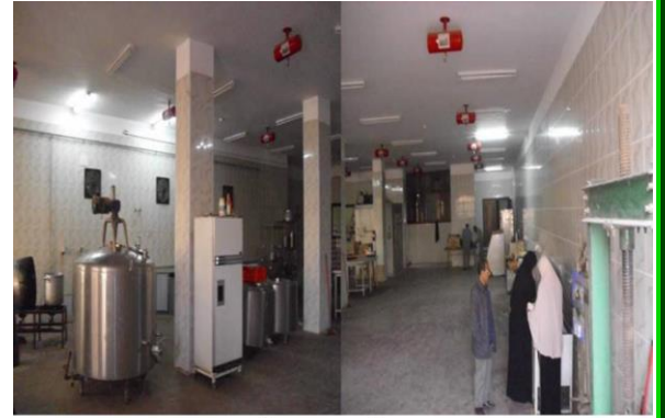
صالة تصنيع الألبان