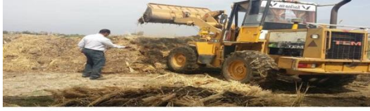
نشاط تدوير المخلفات لإنتاج السماد العضوي (الكمبوست) بوحدة تدوير المخلفات مركز التجارب والبحوث الزراعية بالكلية