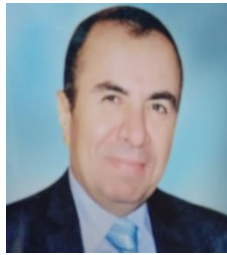
أ.د/ رضا صالح نائب رئيس الجامعة لشئون البيئة وتنمية المجتمع