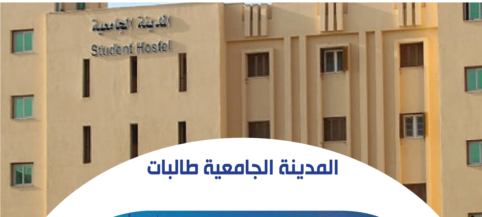
المدينة الجامعية طالبات