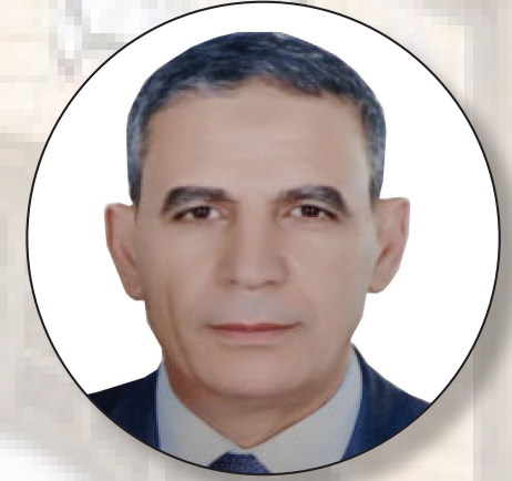
الاستاذ الدكتور حسن حسن يونس نائب رئيس الجامعة للدراسات العليا والبحوث والمشرف على معهد علوم وتكنولوجيا النانو