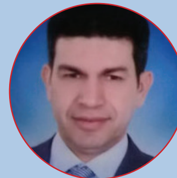
الأستاذ/ خالد القصبى مدير عام شئون التعليم والطلاب