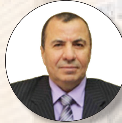
الاستاذ الدكتور رضا ابراهيم عبد القادر صالح ائب رئيس الجامعة لخدمات المجتمع وتنمية البيئة والمشرف على كلية الذكاء الاصطناعي