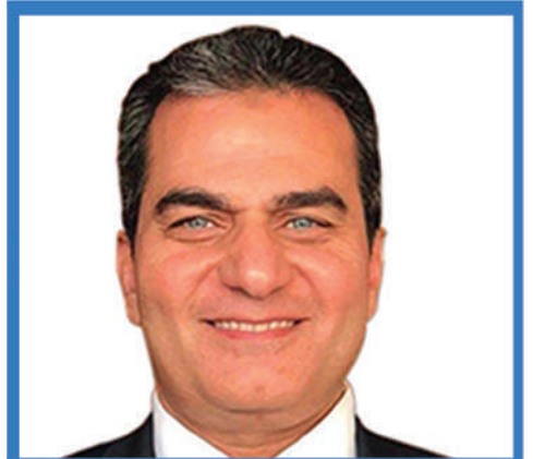
أ.د محمد مصطفى عبدالعال نائب رئيس الجامعة لشئون التعليم والطلاب