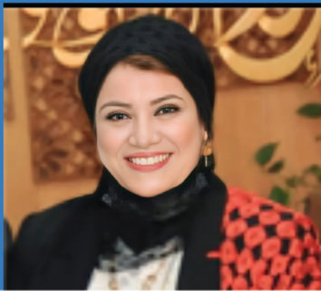
أ.د أماني محمد شاكر نائب رئيس الجامعة لشئون خدمة المجتمع وتنمية البيئة

نأمل أن يكون وقتك كطالب في الجامعة ناجحاً وممتعاً.