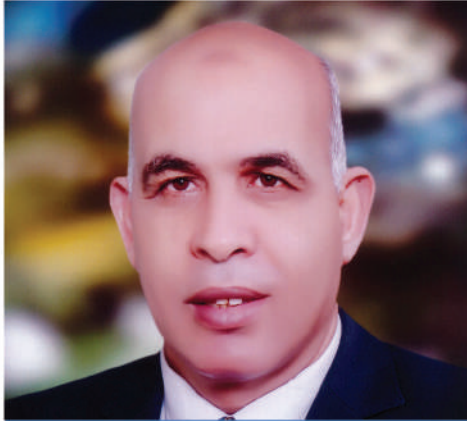
أ.د إسماعيل إسماعيل إبراهيم السيد نائب رئيس الجامعة لشئون الدراسات العليا والبحوث