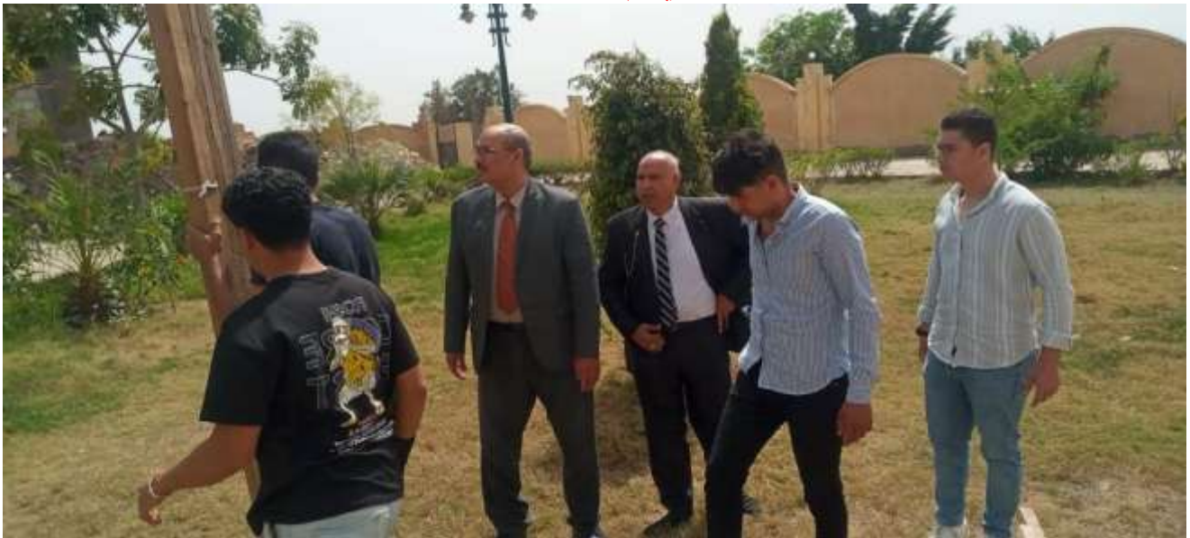
جانب من عمل عشيرة الجواله بالكلية ٢٠٢٣ / ٢٠٢٤ م