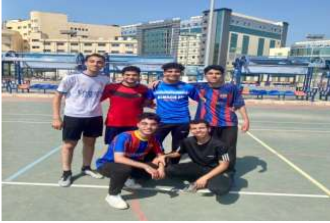
الفريق الحائز على المركز الثاني (فريق الزناري)